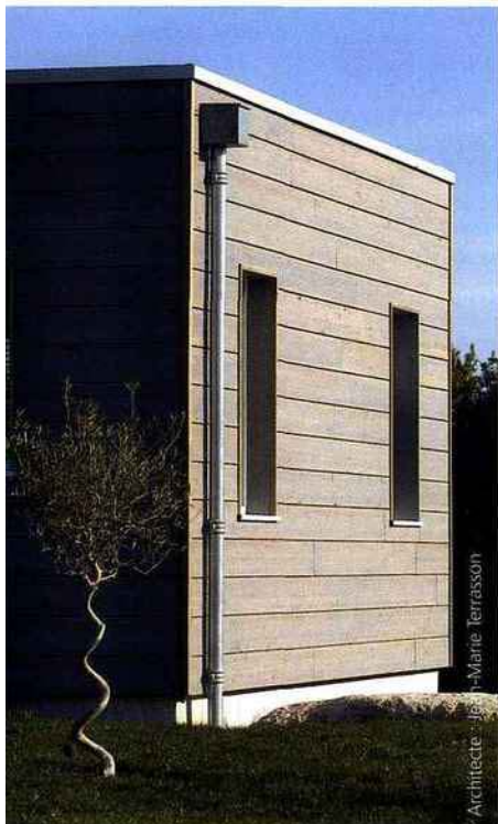
Architecte : Marie Terrasson

Parce que l'apparence extérieure, quoi qu'on en dise, revêt une certaine importance, voici une sélection de produits pouvant embellir sa maison ou simplement raviver son habit.